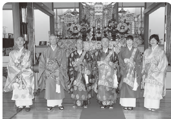
11月3日 秋の報恩講法要にて