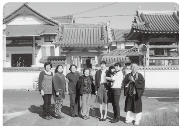
元旦の朝(住職と家族と檀家さん)