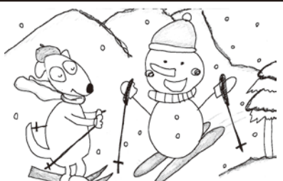
カット： 奥原 綾