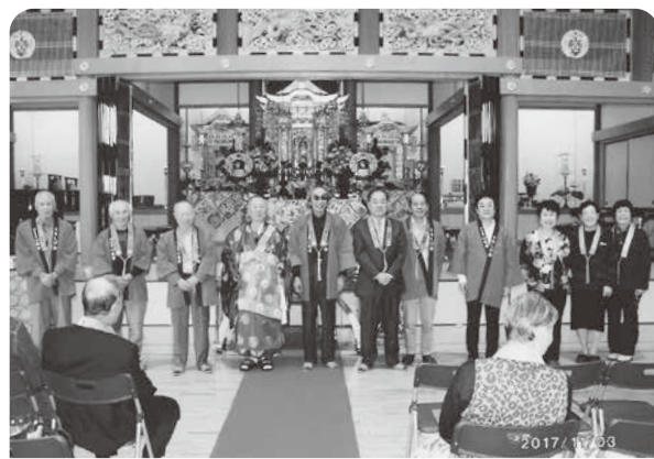
心光寺総代さんたちの挨拶(報恩講法要にて)