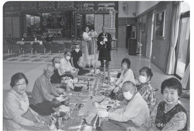
6月1日 心光寺総代たちによる仏具磨き

(2)ある比丘が、「自分は多くの博学な長老のいる教団からこの教えを聞いたのであるから、これは正しく仏説と見なされるべきである」と主張しても、これをそのまま肯定も否定もせずに、(1)のように経と律とに照らして適宜に判定すべきである。合掌(奥原曇龍)