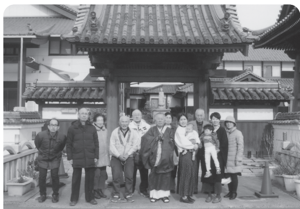
令和8年 心光寺元旦説法の参詣者